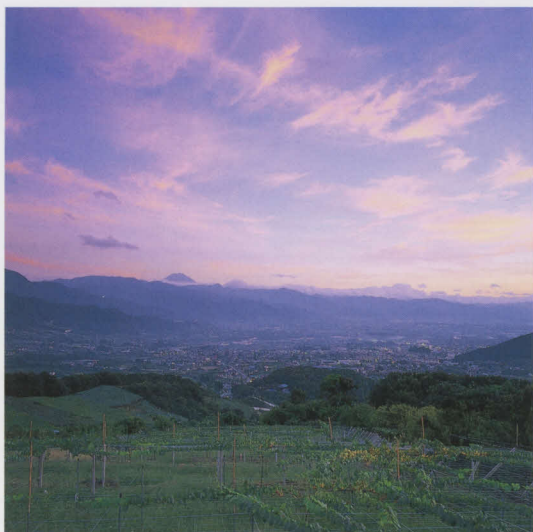
フルーツライン付近から甲府盆地を望む