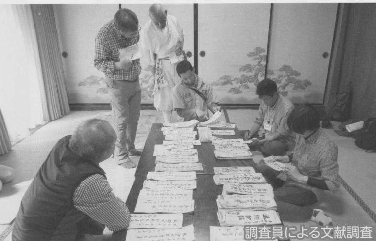
調査員による文献調査