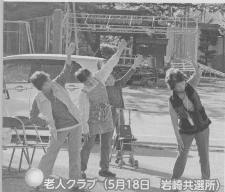
老人クラブ (5月18日 岩崎共選所)