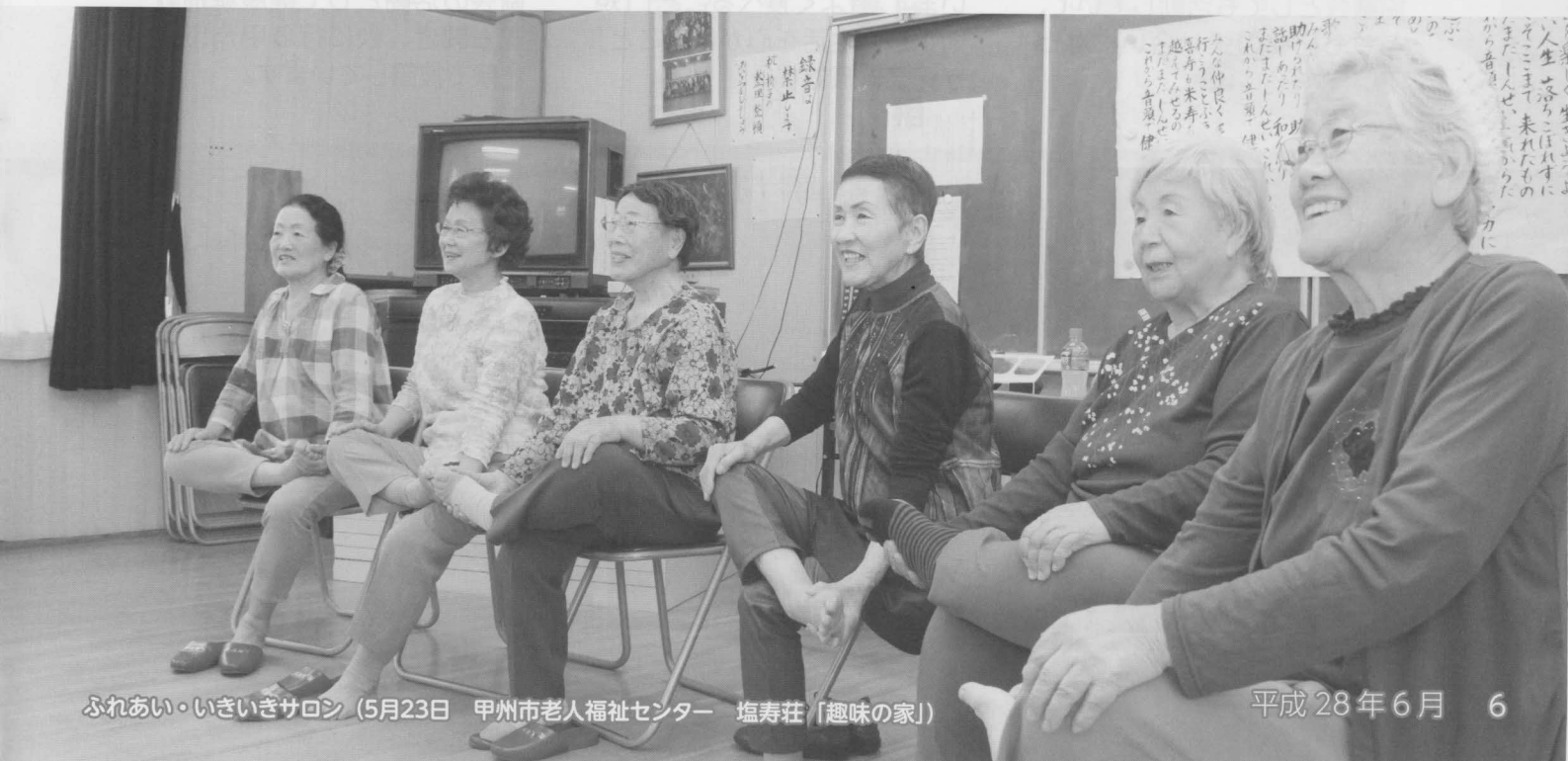
ふれあい・いきいきサロン (5月23日 甲州市老人福祉センター 塩寿荘「趣味の家」)

甲州市では、誰もが住み慣れた地域で、安心して生きがいをもって暮らせる福祉社会の実現に向け、様々なサービスや事業に取り組んでいます。