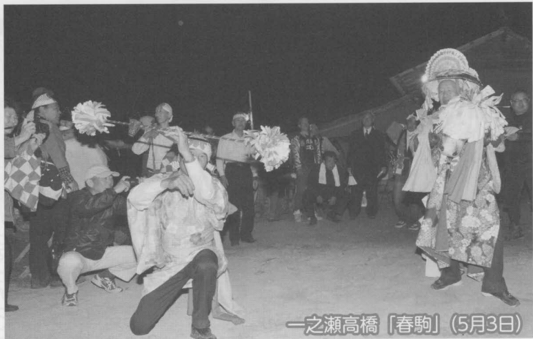
一之瀬高橋「春駒」（5月3日）

市内には様々な地域の伝統と文化が、住民の受け継ぐ心によって継承されています。家内安全、無病息災、果実豊作、開運成就を祈る想いが「祭り」となり、放光寺「大黒天大祭」（4月29日）、一之瀬高橋「春駒」（5月3日）、大善寺「藤切り祭」（5月8日）など、先人から伝わる地域伝統文化が今年も盛大に開催されました。