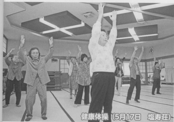
健康体操 (5月17日 塩寿荘)