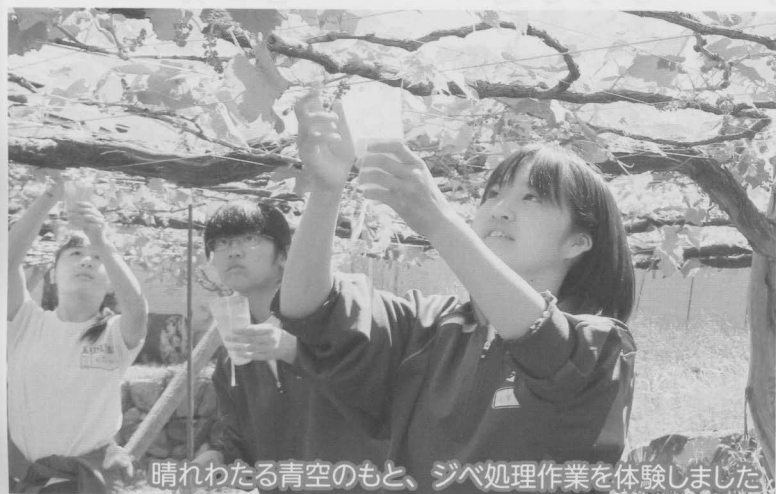
晴れわたる青空のもと、ジベ処理作業を体験しました

5月12日、13日の両日、勝沼中学校2年生が、勝沼町内のぶどう畑でジベ処理実習を行いました。この実習は、ぶどう栽培についての理解や勤労の尊さや奉仕の心を培うことを目的に、実施しています。「おいしいぶどうになってほしい」と生徒の皆さんは、ジベ処理作業を通じて、ぶどう農家の苦労とともに産地の伝統を感じていました。