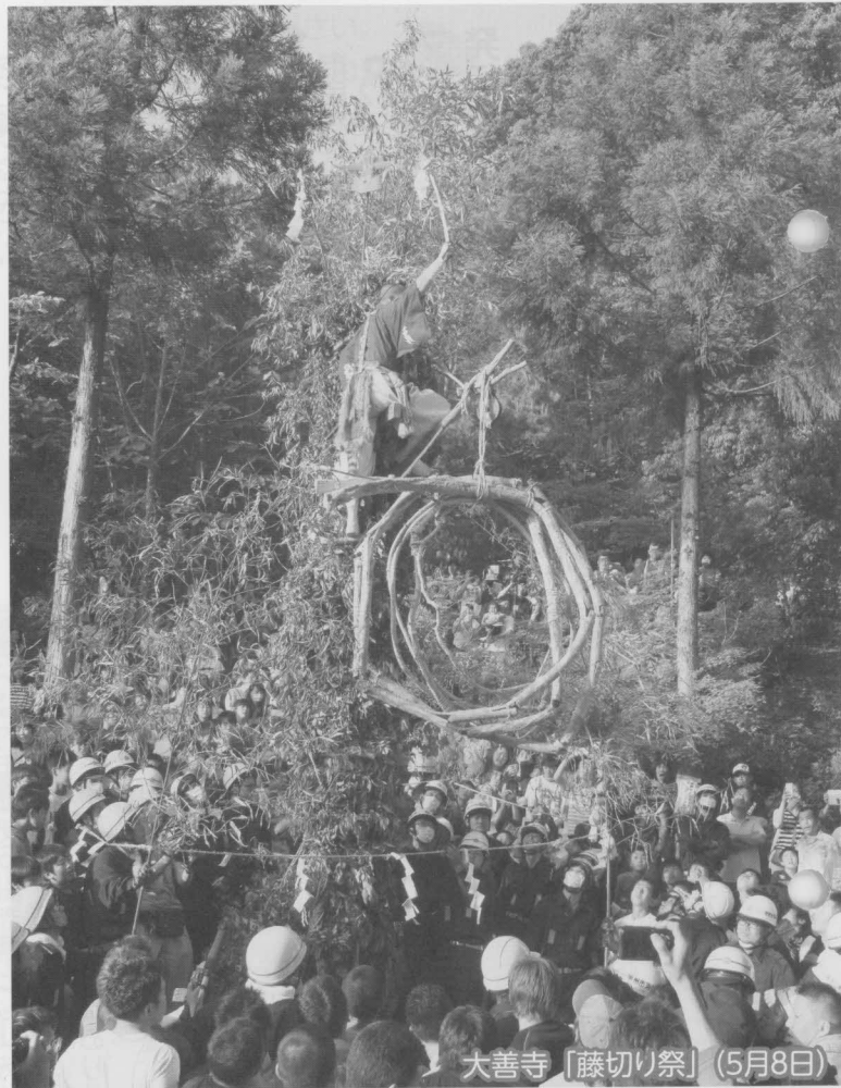
大善寺「藤切り祭」（5月8日）

「藤切り祭」に向けた準備（藤とり、旗たて）から、祭典の流れなどを記録し、年度末には調査報告書としてまとめ、今後の文化財保護と活用につなげていきます。