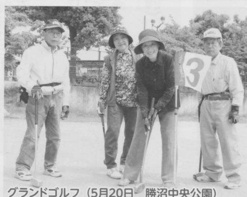
グランドゴルフ (5月20日 勝沼中央公園)