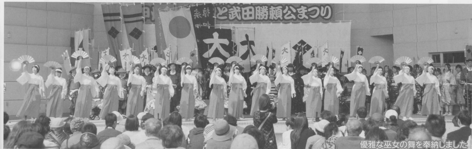
優雅な巫女の舞を奉納しました