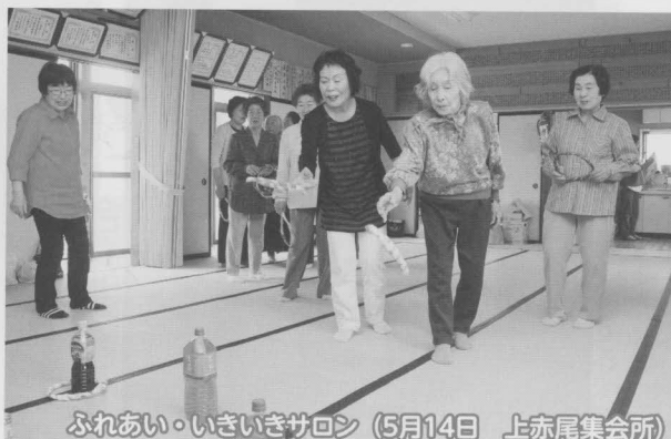
ふれあい・いきいきサロン (5月14日 上赤尾集会所)