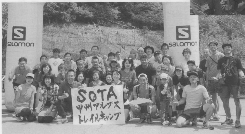
トレイルランで甲州アルプスの魅力を再発見しました。（5月8日）