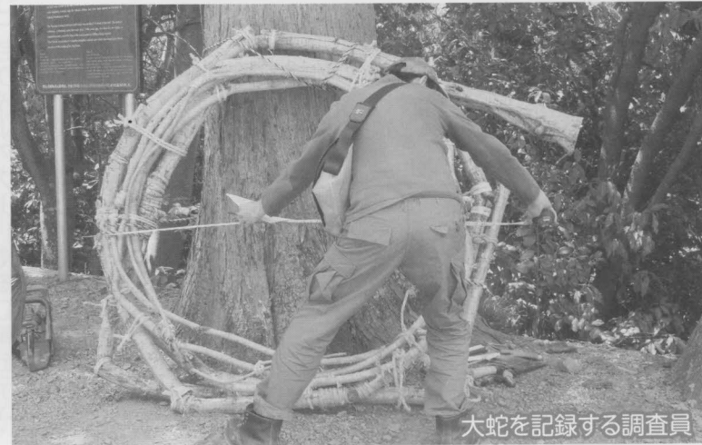
大蛇を記録する調査員