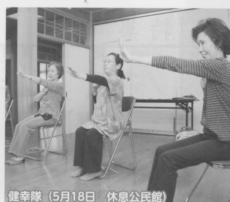
健幸隊 (5月18日 休息公民館)