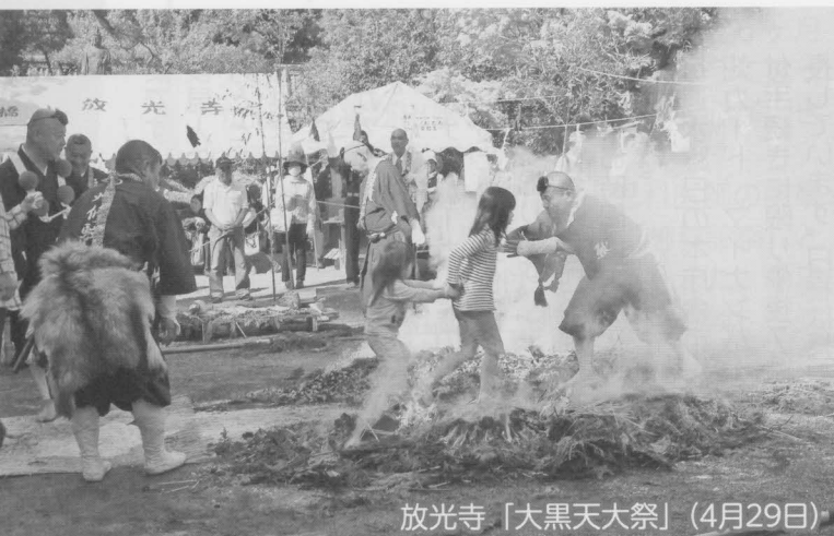
放光寺「大黒天大祭」（4月29日）