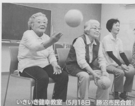
いきいき健幸教室 (5月18日 勝沼市民会館)