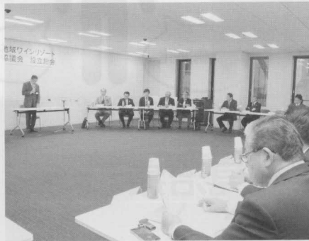
同推進協議会の会長として議事を進行する田辺市長。

2019年度までにワイン関連のイベント企画や施設整備などを進め、今年度から5年間で、峡東地域の観光客の消費額を現状の679億円から780億円（15%増）まで増やす目標を掲げています。