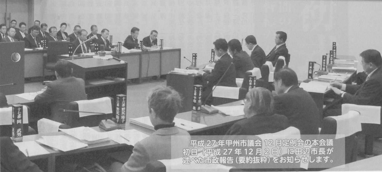
平成 27 年甲州市議会 12 月定例会の本会議 初日(平成 27 年 12 月 2 日)に田辺市長が 述べた市政報告(要約抜粋)をお知らせします。