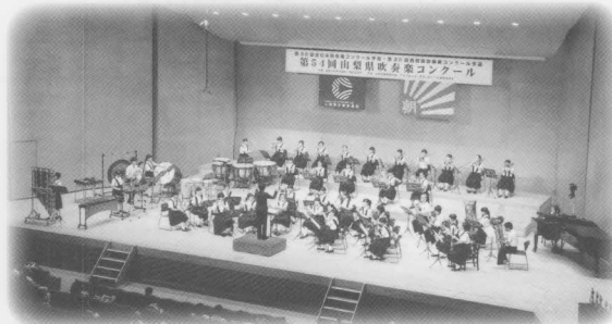
第54回山梨県吹奏楽コンクール銀賞