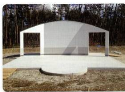
野外ステージ：正面