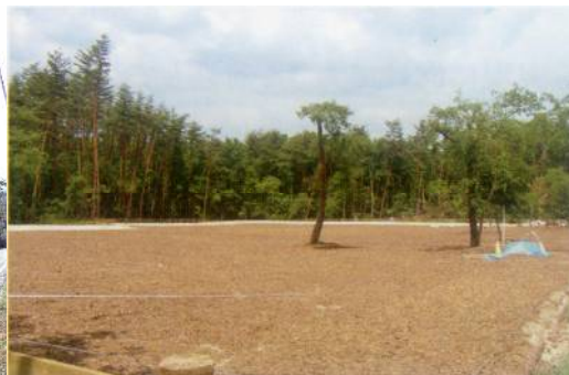
2013年5月造成工事完成