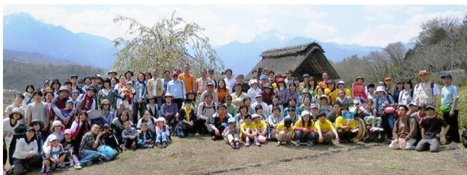
2014年4月春 水車小屋公園にて、背景は甲斐駒ヶ岳

2013年4月 韮崎～白州 22km新緑チャリティーウォーク 5月 日野春～白州 12km新緑チャリティーウォーク 2014年4月 日野春～白州 12km新緑チャリティーウォーク 10月 日野春～白州 12km紅葉チャリティーウォーク