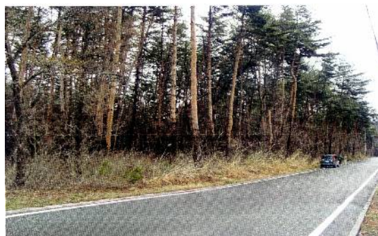
2011年提供された土地は松林