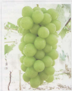
シャインマスカット