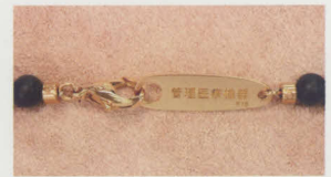
18金製金具には医療機器刻印入り

本商品はジュエリーとしても本格的なつくりをしており、金具やボール等は18金で、シルバー仕様のもは銀で出来ております。