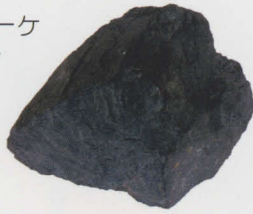
上ノ国町産ブラックシリカ原石

ブラックシリカは世界でただ一ヶ所北海道上ノ国町だけに産出する鉱物(黒鉛珪素)で、数億年前から海底に堆積した動植物が、化石化したものだといわれています。