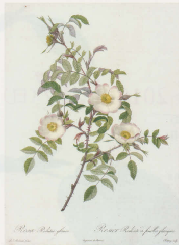
《ロサ・レドゥーテア・グラウカ》『バラ図譜』より コノサーズ・コレクション東京所蔵