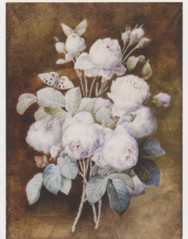
《バラのブーケ》1825年 グロッシュ・ヴェラム コノサーズ・コレクション東京所蔵