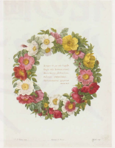
屏絵『バラ図譜』より コノサーズ・コレクション東京所蔵