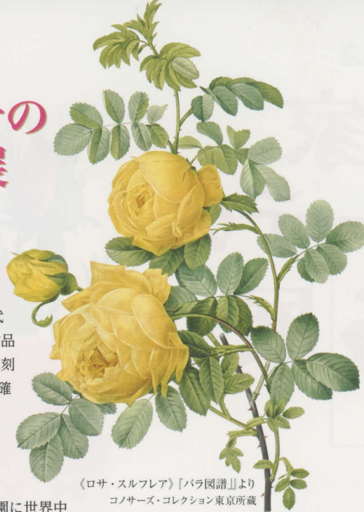
《ロサ・スルフレア》『バラ図譜』より コノサーズ・コレクション東京所蔵

レストランでは通常メニューにバラにまつわる特別メニューが加わり、ミュージアムショップでは華やかなバラグッズも多数展開されます。