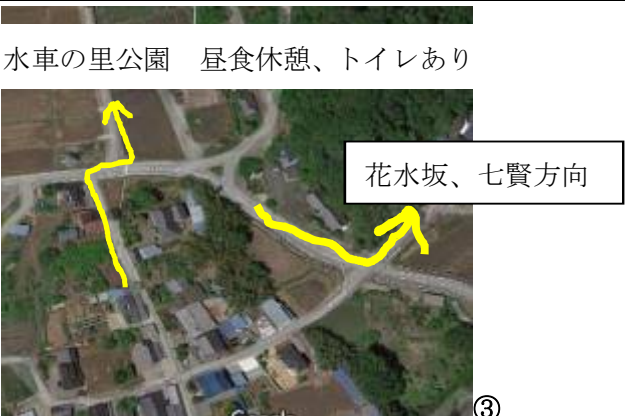
水車の里公園 昼食休憩、トイレあり