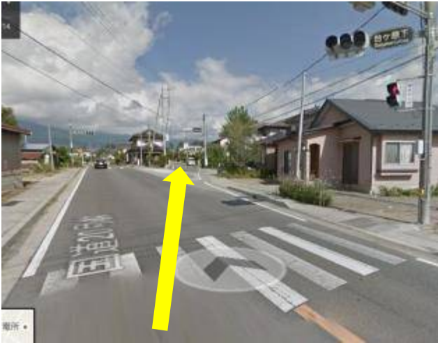
⑧台ヶ原下交差点 渡って、右側の旧道へ進む