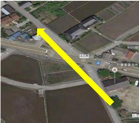
⑤上三吹交差点・・・国道 20 号を渡り旧道を進む