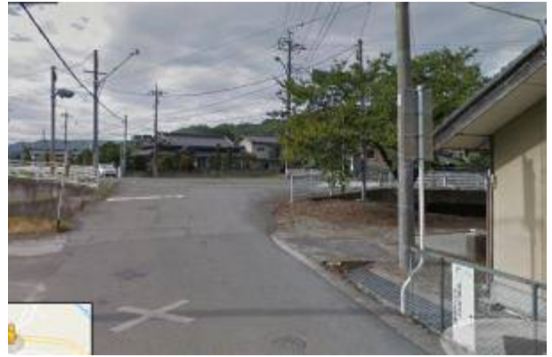
⑤上三吹交差点で国道 20 号を渡り旧道を進む