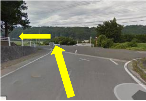
④水車の里公園から出発して最初の交差点を左折