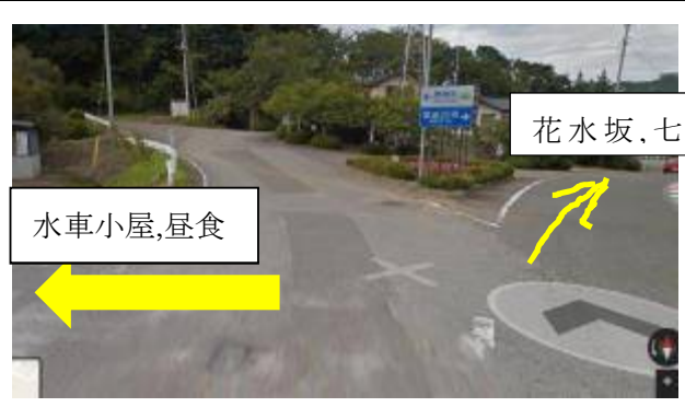
③左折し、水車の里公園・トイレ&食事休憩 休憩後は正面の青い看板の右側の道へ進む