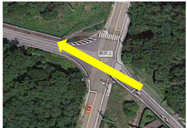
⑩前沢上交差点・・・国道 20 号渡って進む