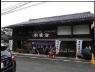
金精軒・・・甘味処です ・元祖信玄餅の店 七賢の斜向かいです ・トイレ借用可