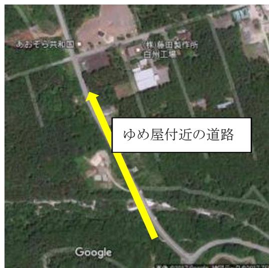
⑪この付近、静かに、止まらずにゴールへ