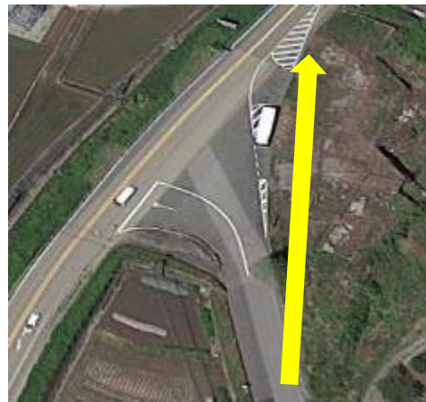
⑥旧道から国道 20 号の右側歩道を花水坂入口へ進む