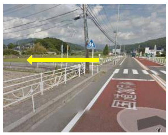
②大武川橋を過ぎて最初の交差点を左折する。