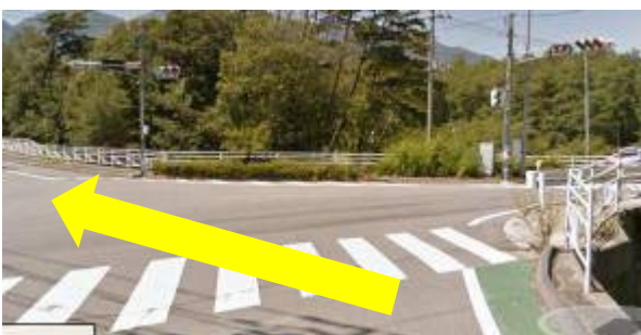
⑩前沢上交差点、国道 20 号渡って進む