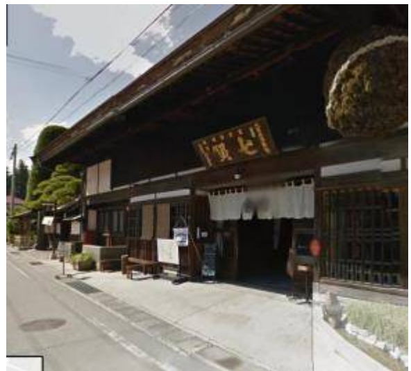
七賢(酒蔵) ここでトイレ休憩 道路反対側の金精軒(甘味処)でもトイレ休憩可