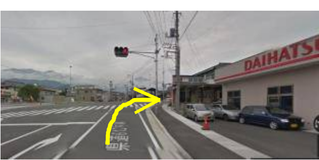
①牧原交差点を渡り、国道 20 号の左側の歩道を、大武川橋に向かう。大武川橋には左側にしか歩道が無い。