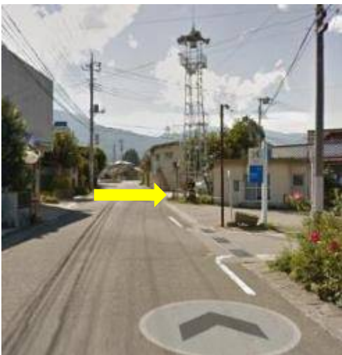
⑨火の見櫓の先で右折して、旧道を進む