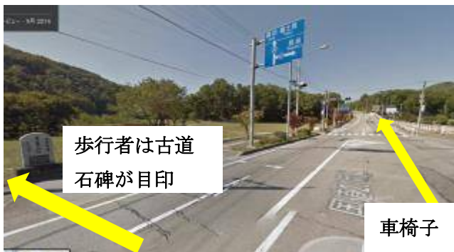
⑦花水坂入口交差点・・・車椅子は 20 号の右側を直進する、歩行者は左側の古道の石碑の横から草道（甲州街道古道）へ入る