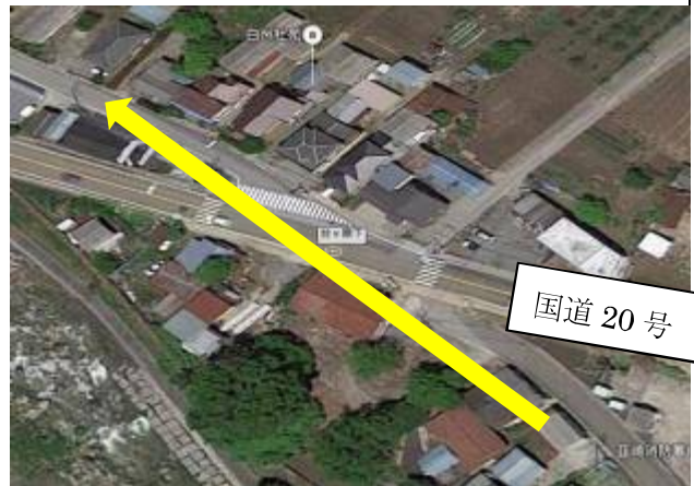
⑧台ヶ原下交差点・・・国道 20 号を渡り旧道を進む